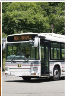
關電鐵道電氣巴士 16mis