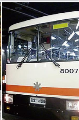
立山隧道無軌電車 10mis